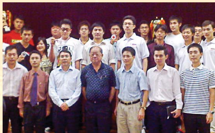
潘会长与获奖留学生等合照

除此以外，新中友协与新加坡中国留学生总会还进行了一系列的交流。正是在这样的背景之下，07年底，新中友协