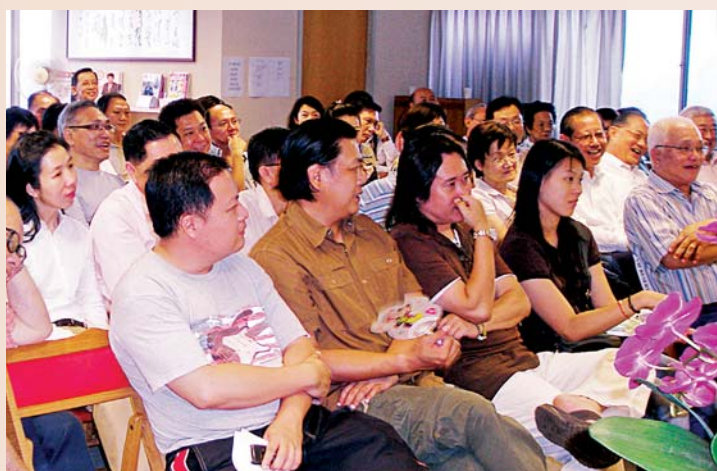
经贸、文化系列讲座现场

on trade and culture. This series was commenced in July 2007. It was conducted by famous scholars, doctors, lawyers, DJ, etc.