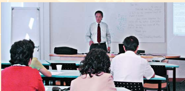
湖北公共文化管理培训班在上课