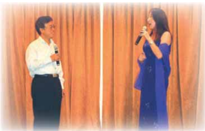
张云大使和田平女士合作现代京剧《沙家浜》片断。

晚会也有中国文艺表演助兴。当中有来自四川的“变脸”、京剧表演、精彩样板戏、民族舞蹈和京胡表演。由于大家难得相聚一堂，张云大使及一些来宾相继与田平老师合唱《沙家浜》，现场掌声热络，宾主尽欢。（世原）