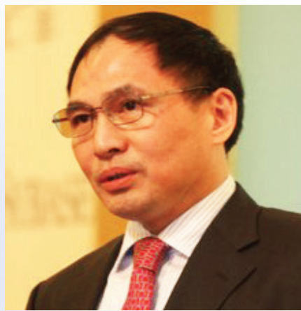
郑永年教授 新加坡国立大学 东亚研究所所长